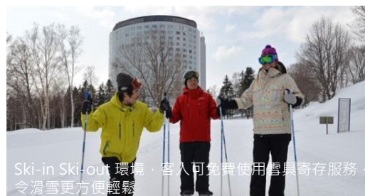
Ski-in Ski-out 環境，客人可免費使用雪具寄存服務，令滑雪更方便輕鬆