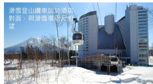
滑雪登山纜車站於酒店對面，與滑雪場咫尺相望