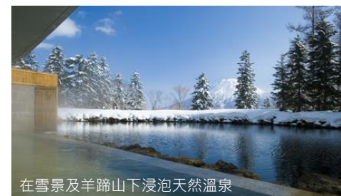
在雪景及羊蹄山下浸泡天然溫泉