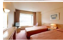
Wing No.4 Twin B