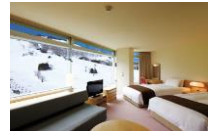
Wing No.2 Family Twin C