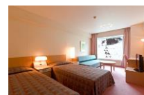
Wing No.4 Twin A