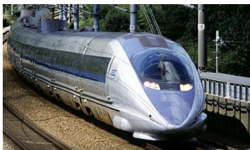
新幹線 Nozomi (のぞみ)