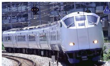
特急 Haruka (はるか)